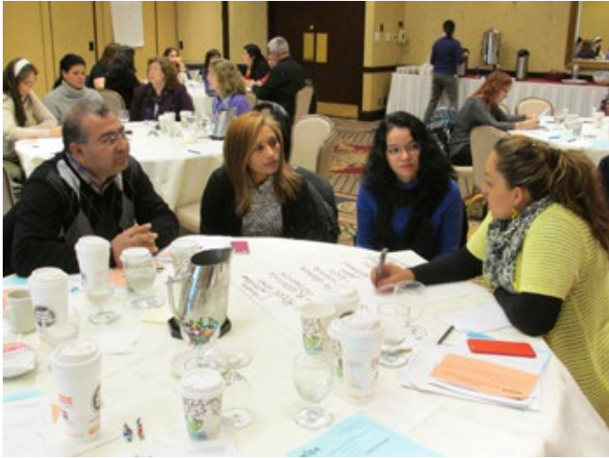
En el mes de octubre de 2014, se reunieron equipos de padres, padres líderes y educadores de Illinois para analizar las prácticas de participación familiar centradas en los aprendices del inglés.